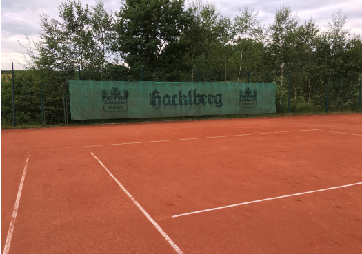
Abbildung: Beispiel für Tennisblende

Die Anordnung kann auf der Innenseite der Zäune erfolgen (s. Abbildung) oder an der Außenseite im Zugangsbereich von Fußballplätzen, Tennisanlage und Eisstockanlage.